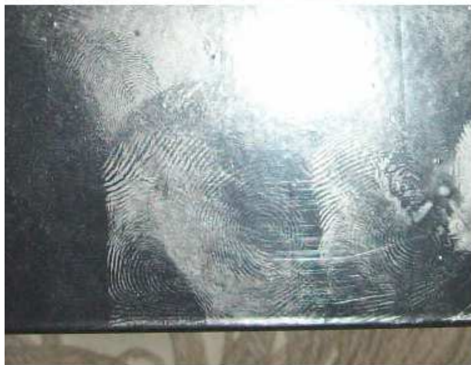
Fotos do cofre de aço impressas no Relatório Papiloscópico nº M59/2012 datado de 03/09/2012 , confeccionado pelo relator e incluído no I.P. XXX/2012 .