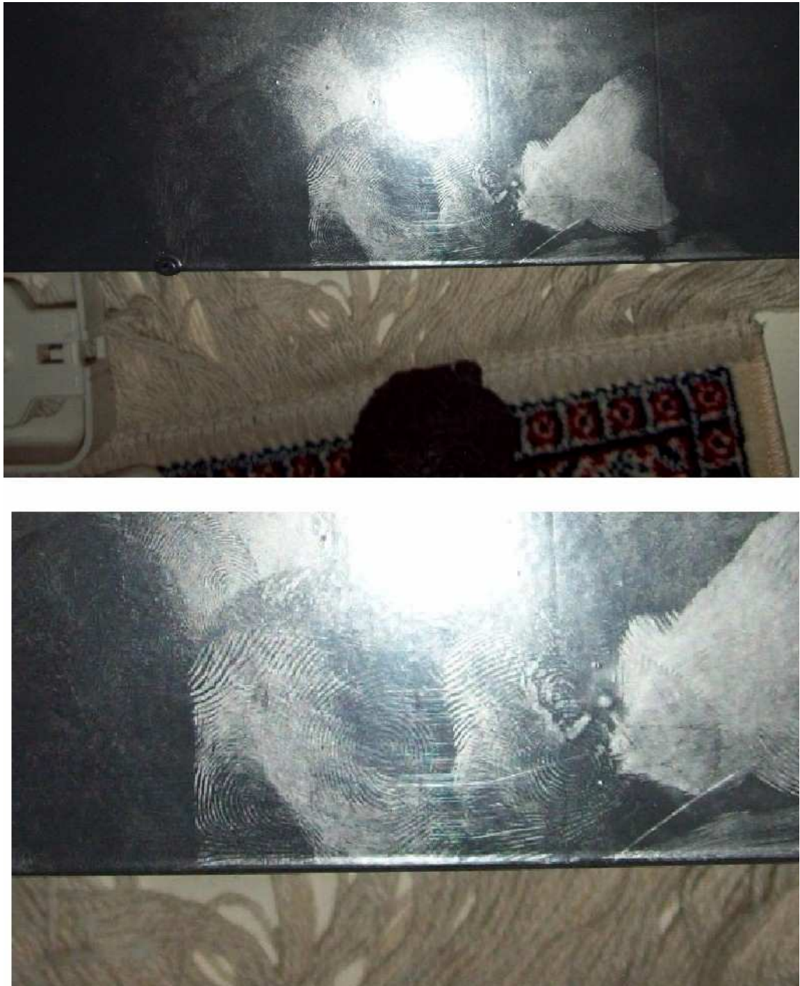
Fotos dos fragmentos de impressão digital, revelados e fotografados, ainda no cofre de aço, o qual foi manipulado por XXXXXX XXXXXX XXXXX XX XXXXXXXXX.