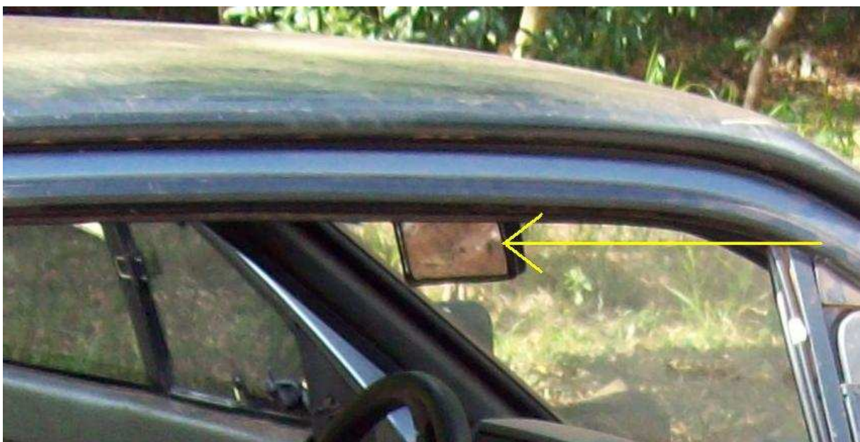
Foto com seta indicando o fragmento de impressão digital encontrado e revelado pelo Papiloscopista, ainda no local – Peça de exame.

Foto do veículo, ainda no local, com a seta apontando para o retrovisor interno, onde foi localizado o fragmento de impressão digital – Peça de Exame.