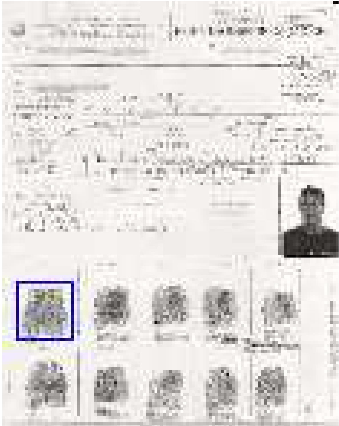
Foto da Ficha de Identificação Civil (FIC) de XXXXXXXX XXXXXXXX, com destaque para a impressão Digital do Polegar Direito - Padrão de Confronto.