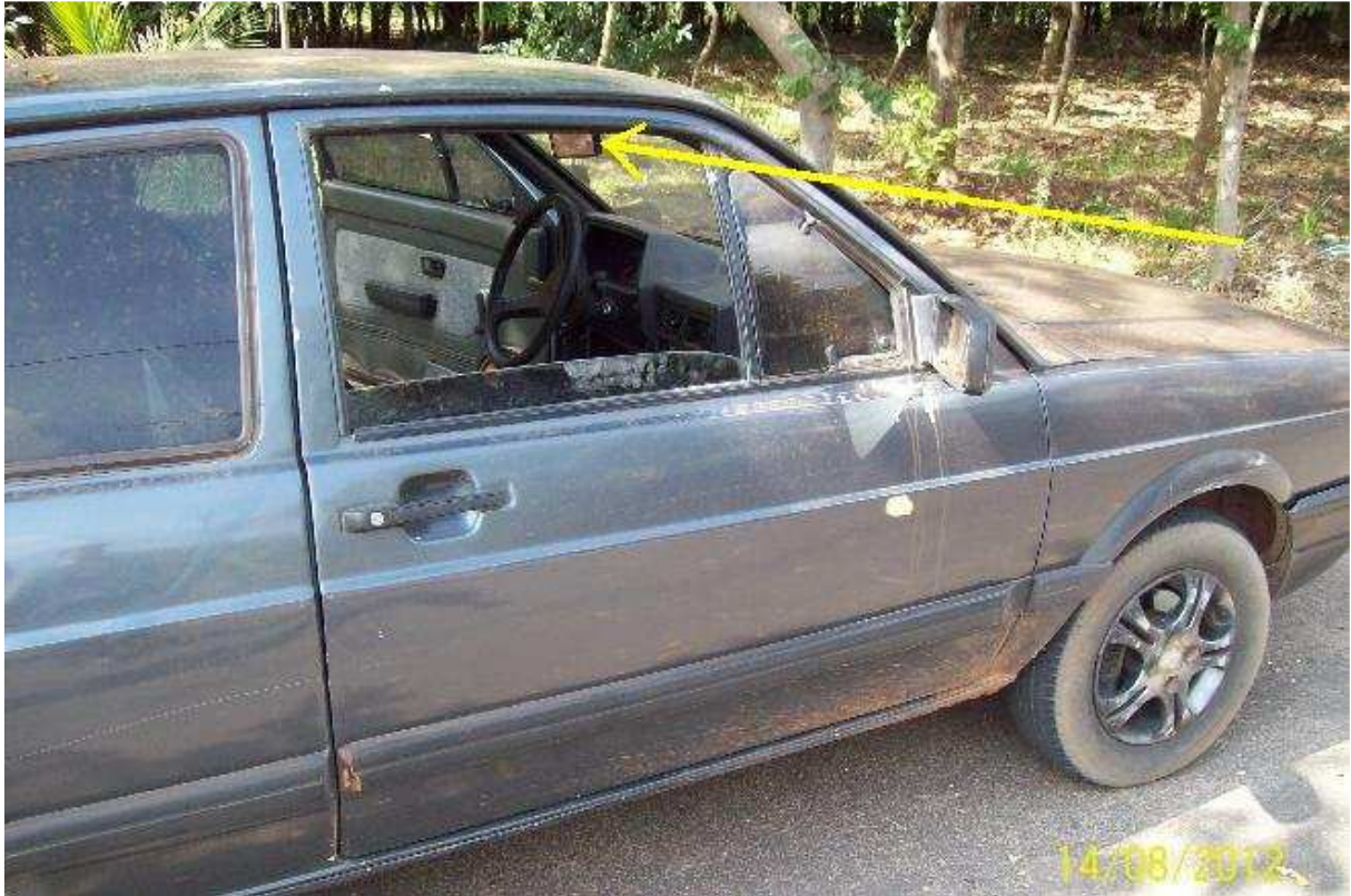
Foto do veículo, ainda no local, com a seta apontando para o retrovisor interno, onde foi localizado o fragmento de impressão digital – Peça de Exame.