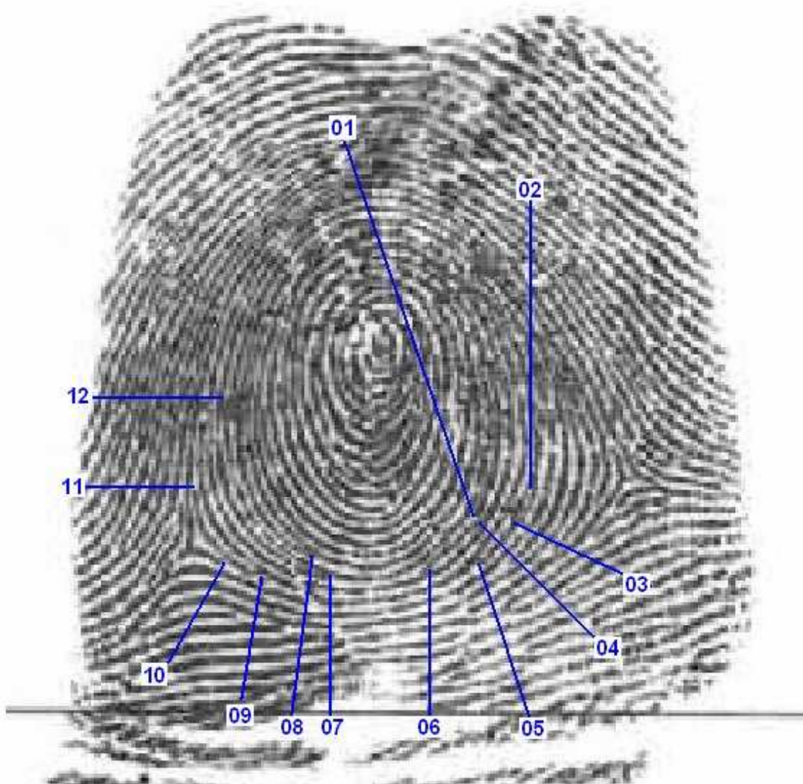
Foto ampliada da impressão digital do polegar direito da ficha de Identificação Civil de XXXXX XXXXXX – padrão de confronto - com 12 setas apontando os pontos característicos coincidentes com a peça de exame.